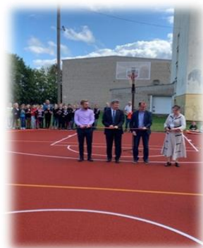
25 pav. Perkirpta simbolinė juostelė prie naujai išlietos minkštos dangos sporto aikštelės