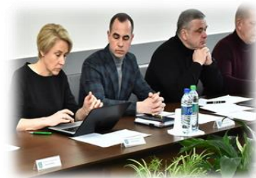
5 pav. Komiteto posėdžio metu

Be minėtų klausimų, Komitetas aptarė, vertino ir teikė Savivaldybės tarybai Savivaldybės administracijos parengtus sprendimų projektus dėl disponavimo Savivaldybei priklausančiu turtu: jo perėmimo ar perdavimo, suteikimo nuomos ar panaudos teise, jo nurašymo ir likvidavimo. Taip pat svarstė sprendimų projektus dėl plotų, siūlomų įtraukti į neprivatizuojamų žemės sklypų sąrašą, dėl