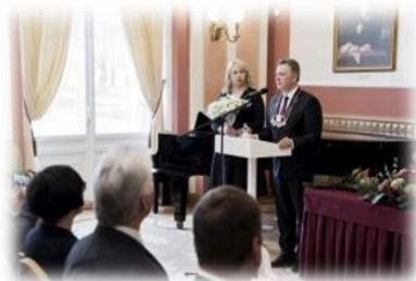
18 pav. IX šaukimo Plungės rajono savivaldybės tarybos posėdis