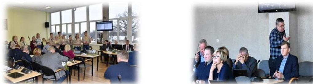
3 pav. Tarybos posėdžio metu