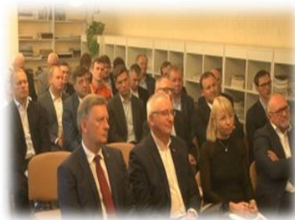
27 pav. Akimirka iš Plungės rajono pramonininkų sąjungos surengtos konferencijos

Plungės rajono savivaldybės administracija, Lietuvos automobilių kelių direkcija, akcinė bendrovė „Lietuvos geležinkeliai“ sėkmingai įgyvendino projektą „Tunelinio viaduko po geležinkeliu Plungės m. Dariaus ir Girėno g. įrengimas“. Šis projektas savo darbų apimtimi buvo pats didžiausias ir sudėtingiausias, koks apskritai kada nors įgyvendintas savivaldybėje. Tarptautinį konkursą laimėję rangovai tesėjo išpareigojimus ir tunelį po geležinkeliu Plungės mieste pastatė per 17 mėnesių.