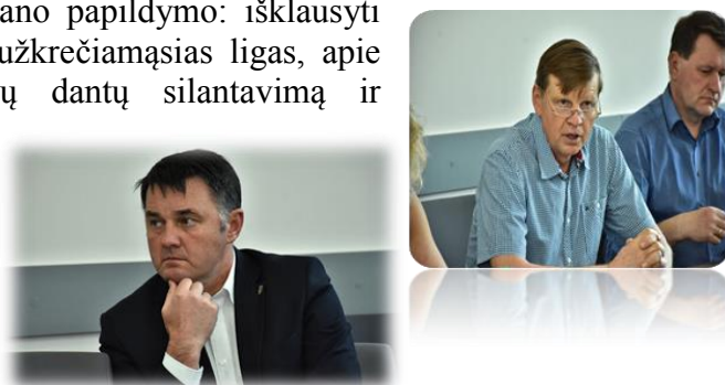
6 pav. Komiteto posėdžio metu