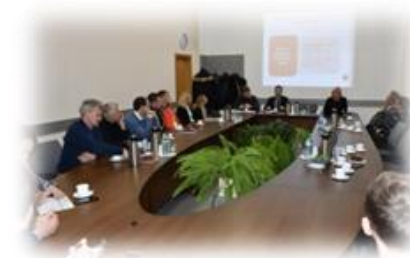
13 pav. Verslo pusryčių akimirka

Kovo 1 d. Žemaičių Kalvarijos Motiejaus Valančiaus gimnazijos pirmo aukšto patalpose buvo atidarytas vaikų darželis.