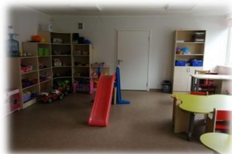
16 pav. Grupių atidarymo akimirkos