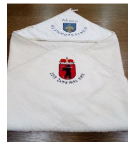
10 pav. Dovanėlė mažyliui