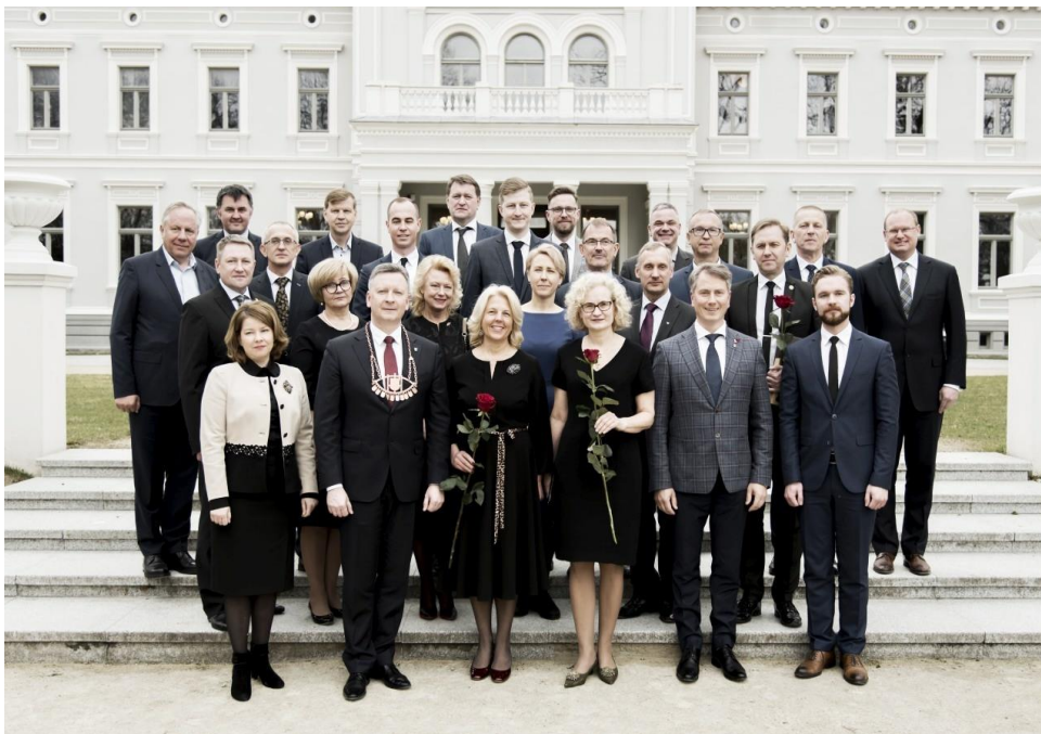
1 pav. 2019–2023 m. kadencijos Plungės rajono savivaldybės taryba