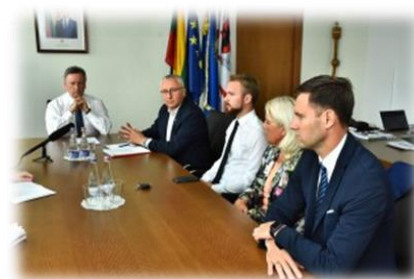
26 pav. Spaudos konferencijos akimirka

Spaudos konferencijoje buvo įvardytos gatvės ir keliai, kuriuos planuojama rekonstruoti artimiausiu metu, gavus Lietuvos automobilių kelių direkcijos programų finansavimą.