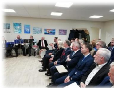
29 pav. Akimirkos iš VšĮ Plungės bendruomenės centro įkurtuvių šventės