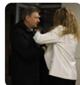
11 pav. Sausio 13-osios paminėjimo akimirkos

Sėkmingai baigtas įgyvendinti pirmasis tikslinės teritorijos Plungės mieste sutvarkymo projektas – 2019 m. sausio 28 dieną prie aktyvaus poilsio ir pramogų zonos Plungės mieste, M. Oginskio dvaro teritorijoje, prie autobusų stoties, perkirpta simbolinė įkurtuvių juostelė.