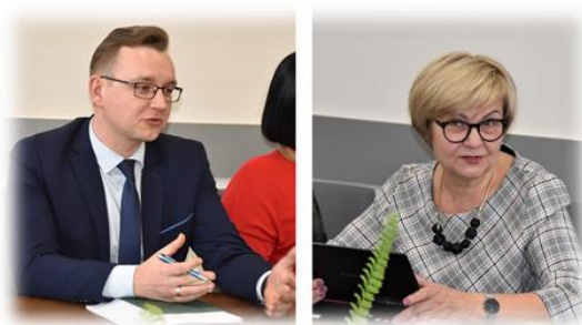
4 pav. Komiteto posėdžio metu

Per metus posėdžiuose aptarta nemažai einamųjų klausimų, susijusių su ugdymo proceso organizavimu.