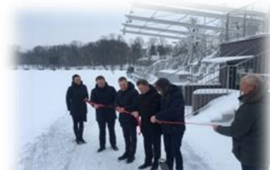
12 pav. Perkirpta simbolinė įkurtuvių juostelė

Nors sutartis turėjo baigtis tik kovą, projekto rangovai – UAB „LitCon“ ir UAB „Plungės lagūna“ – jau baigė visus numatytus darbus ir perdavė Plungės rajono savivaldybės administracijai eksploatuoti M. Oginskio dvaro teritorijoje sukurtą aktyvaus poilsio ir pramogų zoną. Tikimasi, kad sukurta nauja traukos zona prisidės prie verslumo augimo ir darbo vietų steigimo Plungės mieste.