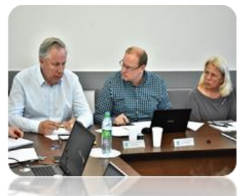
7 pav. Komiteto posėdžio metu