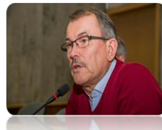
8 pav. Komiteto posėdžio metu